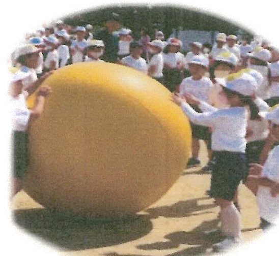
*チームのなかまと力を合わせて大玉を転がしました!!