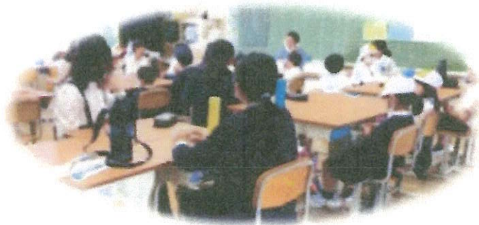
*顔合わせをする担当の先生方と子どもたち

今年度は、ゴールデンウィーク明けから新型コロナウイルス感染症が5類になったということで、学校における子どもたちの活動にも広がりが見られます。そのひとつに縦割り班活動があります。全校児童が、赤・青・黄の3色グループのいずれかに所属し、日々の中では清掃活動を、行事の際には各色グループの6年生が中心となりその行事を進めてくれます。1年間一緒に過ごすなかまとの顔合わせ(自己紹介など)をしてから、活動を始めます。まずは、5月17日に行った「1年生を迎える会」の様子から紹介します。