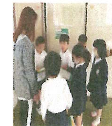
*2年生による1年生への校舎案内(2年生が頼もしく感じました。)