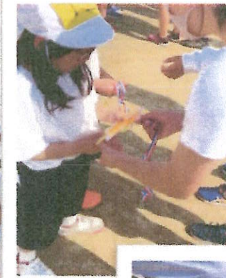
*ゲームの後は、2～6年生のみんなで作ったメダルを6年生が代表して1年生の首にかけてくれました。