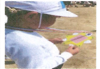
*メダルに書かれたメッセージを一生懸命に読んでいました。